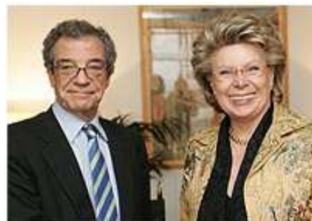
Viviane Reding acompañada por César Alierta, presidente de Telefónica.

La comisaria de la Unión Europea, Viviane Reding, manifestó en mayo que no "era sostenible que el gobierno de un solo país tenga el control de la red utilizada por centenares de millones de personas de todo el mundo".